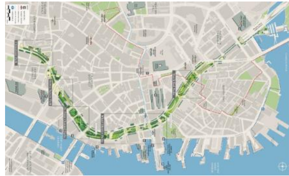
Rose Kennedy Greenway, בוסטון, ארה"ב (2008)