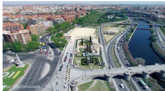
madrid rio, מדריד, ספרד (2011)