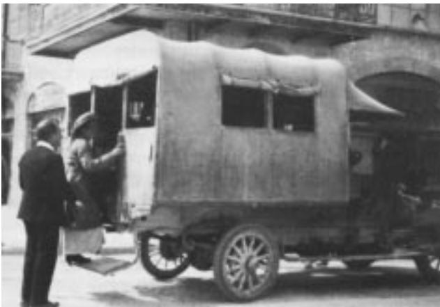
התחבורה הציבורית בראשיתה של תל-אביב

מגיבורי דוד. אחיהם הצעיר של אבישי* ויואב*. נודע כְּאָחיו בשם אמו צרויה, אחותו של דוד המלך*. יותר מכול הצטיין במהירות ריצתו: "ועשהאל קל ברגליו כאחד הצבִים אשר בשדה" (שמואל ב, ב). בקרב שהתפתח בין "עבדי דוד" ובין "עבדי איש בושת בן שאול" התעקש להילחם עם אבנר* בן נר, והלה הרגו.