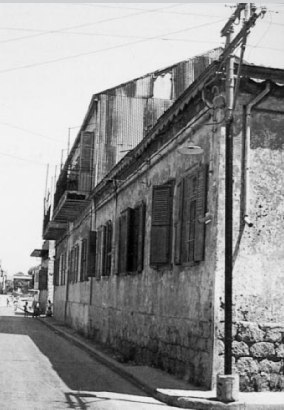
בית הספר לבנות (האוטונומיה הרוסית)