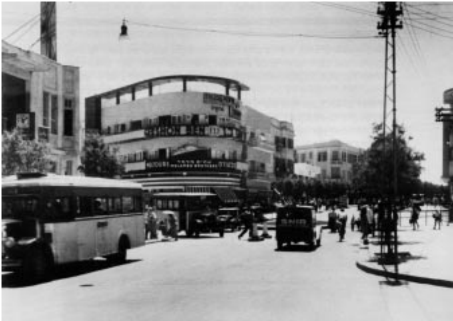
רחוב אלנבי – 1934

סרני, אנצו חיים (1905–1944) (20) א 3 מהצנחנים שליחי היישוב שהתנדבו לצבא הבריטי במלחמת העולם השנייה. נולד באיטליה, היה חבר בארגונים ציוניים-סוציאליסטיים ועלה לארץ-ישראל ב-1926. היה ממייסדי קיבוץ גבעת ברנר. נשלח לגרמניה להכשרת נוער לעלייה ב-1931–1934. במלחמת העולם השנייה נשלח לעיראק ואירגן מחתרת ציונית לעלייה; אחר כך יצא בשליחות בריטית יהודית, וצנח מעבר לקווי האויב כדי לעזור ליהודים, כחנה סנש* וחביבה רייק*. צנח באיטליה, נתפס בידי הגרמנים ונרצח בדכאו ב-1944. על שמו קיבוץ נצר סרני סמוך לנס ציונה שהוקם ב-1948 בידי ניצולי מחנות ריכוז נאציים ונקרא תחילה בוכנוואלד.