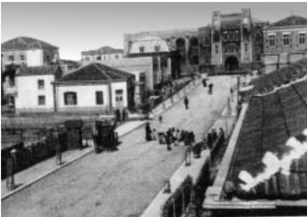
רחוב הרצל וברקע גמנסיה הרצליה

קיבוץ בעמק בית שאן. הוקם ב-1948, אחרי שחרור בית שאן במלחמת העצמאות ולא הרחק מעיר עתיקה זו.