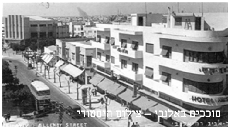
סוככים באלנבי – צילום היסטורי

סוכך/מרקיזה – בחתך שיפועי, בשלב של תכנון קומה מסחרית שלמה, הצללה תהיה אחידה. לא תותר מרקיזה בחתך עגול. גוון המרקיזה יהיה בגוון המבנה, או כפי שיתואם עם המחלקה לשימור.