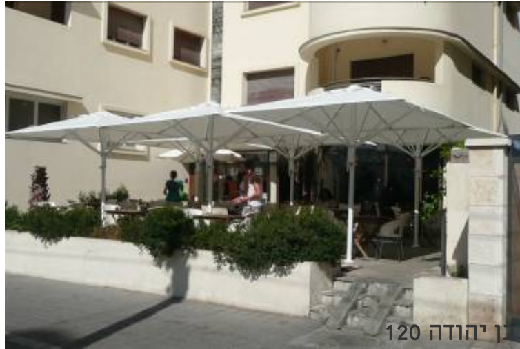
דוגמאות לפרגודים שהותקנו עפ"י הנחיות השימור