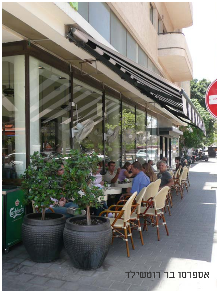
אספרסו בר רוטשילד